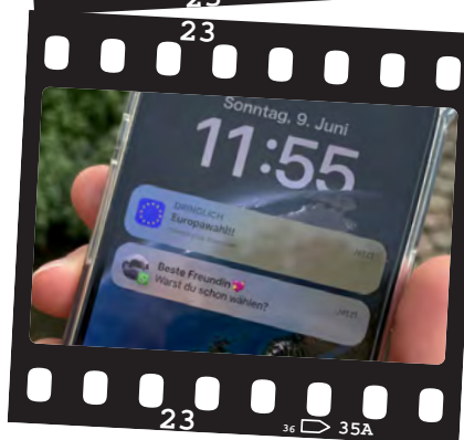
„Einfach.Unkompliziert. Wahl. (E.U.Wahl)“ Marienschule Münster