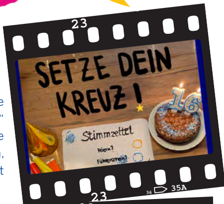
„Meine erste Priorität – Wählen“ Europaschule Ostendorf-Gymnasium, Lippstadt

Jahresmotto 2023: Meine erste Wahl: Europa!