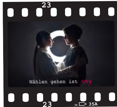
„Wählen ist sexy (Lesbian Edition)“ Walter-Gropius-Berufskolleg, Bochum